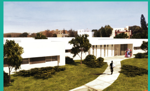
Centre Cardio-Pédiatrique Cuomo - Dakar, Sénégal

UN GRAND MERCI POUR VOTRE CONFIANCE ET VOTRE SOUTIEN !