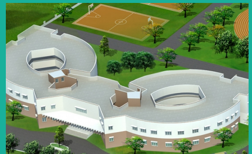
Ecole écologique - Mambakkam, Inde