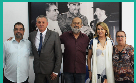
Programme de bourses EICTV - San Antonio de Los Baños, Cuba